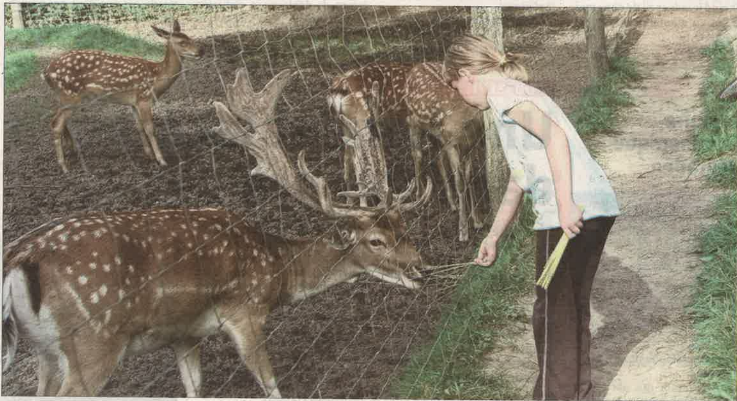
Dans les environs, on peut également découvrir le Parc animalier de Karlsbrunn.

des écuries... En fait, il n'est occupé que pendant de courtes périodes de 8 à 15 jours, pendant lesquelles le comte et ses invités partent chasser le sanglier, le cerf ou les faisans et même, semblerait-il, le loup. À chaque fois, les villageois sont mobilisés pour apporter leur concours. Le soir