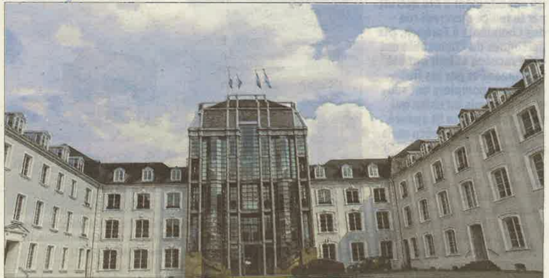
Le château de Sarrebruck tel qu'on le connaît aujourd'hui a été édifié au XVIII e siècle puis remanié dans les années 1960. Mais une forteresse existait déjà à cet endroit au Moyen-Âge.

Les vestiges de la tour (Roter Turm) qu'on découvre dans les sous-sols du musée, attestent du fait qu'au XIII e siècle, on était en présence d'une puissante forteresse. Au XVII e , cel-