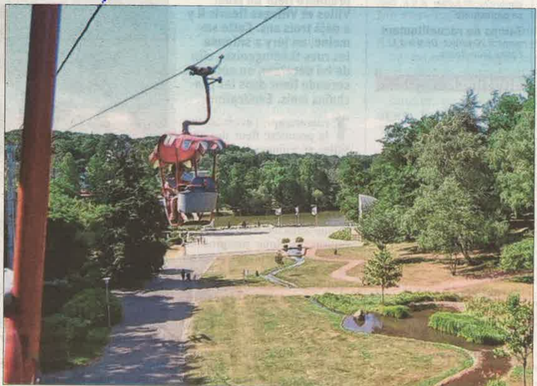
Les télésièges du jardin de Sarrebruck se situent à sept mètres de hauteur, en moyenne.

Malgré tous les efforts, l'appareil commandé à la société sarroise Heckel, avec une licence italienne Carlevaro, ne fonctionne pas le jour de l'inauguration des floralies. Deux stations ont été aménagées, celle de la vallée, en dessous de l'actuel hôtel Vic-