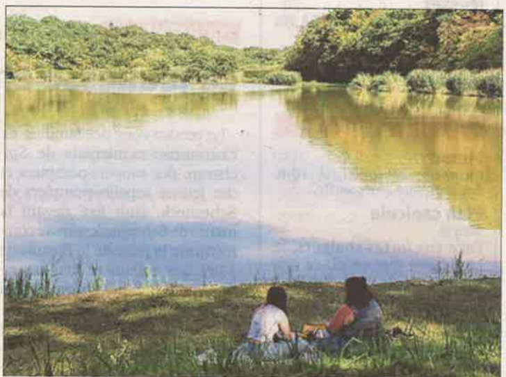
L'étang de Diebling sera le théâtre d'un pique-nique gastronomique le 18 août.

Avant ces deux manifestations, une autre sortie mérite l'attention. Le cadre est ici un peu moins verdoyant, mais fait partie de l'histoire de notre région. Il s'agit d'une découverte des cités minières de Petite-Rosselle. Une balade en bus à travers la commune, berceau du charbon lor-