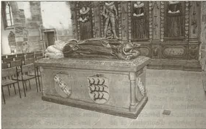
La collégiale accueille la sépulture d'Henning von Stralenheim, baron d'origine suédoise.

est considérée comme l'un des plus remarquables d'Allemagne édifices religieux médiévaux les du sud.